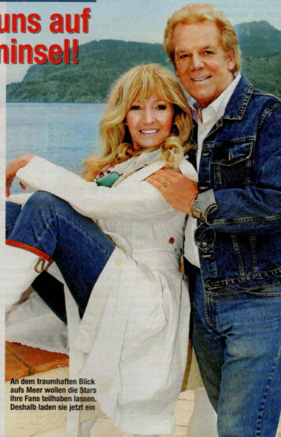
An dem traumhaften Blick aufs Meer wollen die Stars ihre Fans teilhaben lassen. Deshalb laden sie jetzt ein

Erfolg. Und dann schwelgen sie in Erinnerungen: Vor 25 Jahren standen die singenden Eheleute zum ersten Mal gemeinsam im Tonstudio. Das war im Frühjahr 1985, sie nahmen den Song „Ich habe mich heut' Nacht an dich verloren“ auf. „Als Ehepaar auf der Bühne zu stehen, war zunächst nur