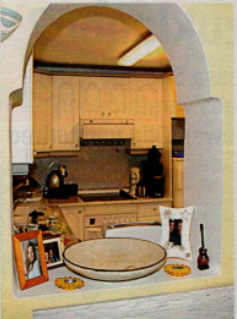
Der Blick durch das offene Fenster in die Küche ist sehr originell. Auch eine Idee von Judith Jersey