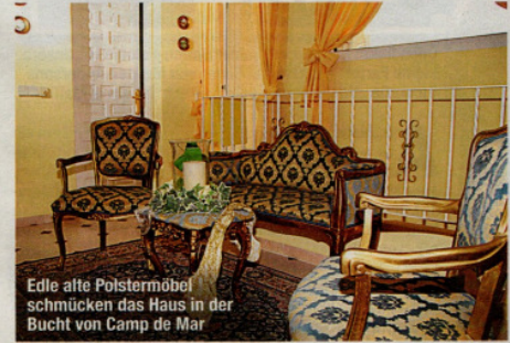
Edle alte Polstermöbel schmücken das Haus in der Bucht von Camp de Mar